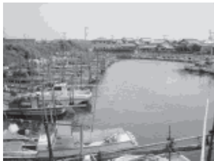
<写真 3 >入出漁港の舟溜り

浜名湖の西岸、松見ヶ浦から新所、鷺巣周辺。松見ヶ浦はヨットやジェットスキーなどのマリナーの基地になっている。宇津山城跡の小山を背景にして白い帆柱が立ち並び様はリゾート地としてのポテンシャルを感じさせる。また、入出漁港は石積みの船溜りに小船がもやう小漁港。船の出入りには今でも「手漕ぎ」の櫓を操るといふ。ゆったりとした時間が流れる一昔前の漁村の風情が残されている。新所は舞阪から堀留運河を通して浜松と結ぶ「渡し」の渡船場、鷺津は奥浜名湖と表浜名湖を結ぶ「巡航船」の汽船場としてそれぞれ湖上を巡る水上交通の要所であった。湖西市は畜産と農業が盛んであったが、近