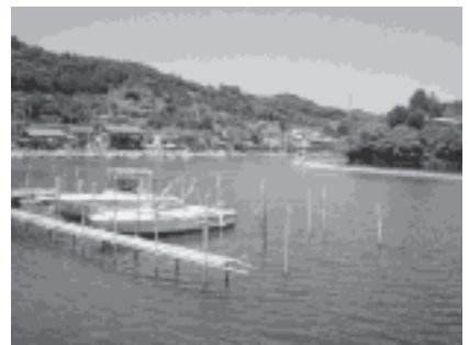
<写真 2> 奥浜名湖寸座の入り江