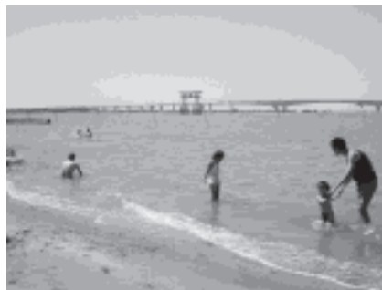
<写真 1> 弁天島海浜公園