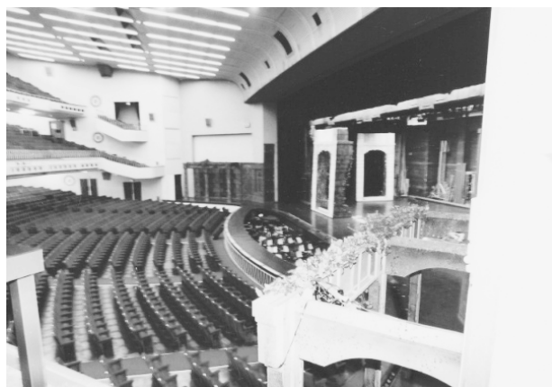
写真 - 3. 東京宝塚劇場 調光室から見るフロントステージ （昭和9年開場 - 平成9年12月14日）

明治39年2月2日『中央新聞』に掲載された保岡工学士は「大劇場設立の問題」において次のように述べている。「殊に日本の歌舞伎に通じ、其の技術と舞台の関係如何を充分に会得した頭脳を有して居無ければならぬ、さもないと、只欧米劇場の賛美にばかり心配して、一も欧米式二も欧米式となり、其の結果床の浄瑠璃や下座の囃子をオーケストラに移したり、花道を廃したりするような珍案も出来して、数百年来一種独特の美を備へて発達し来つた、日本の歌舞伎の所作事は、模範劇場の為に打ち壊されるような始末になる。(略)」と帝国劇場誕生の時期における発言がある一方で、明治45年4月7日『読売新聞』に掲載された「日本の劇場の舞台透視法」 xxii クウルト・グラアザが日本の劇場の本質をつく。「日本には、棧敷に当たる小さい枱があるのであるが、一定の方向があるのではな