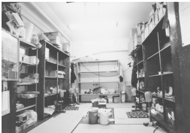
写真 - 5 . 同劇場内床山部屋 (昭和9年開場 - 平成9年12月14日)