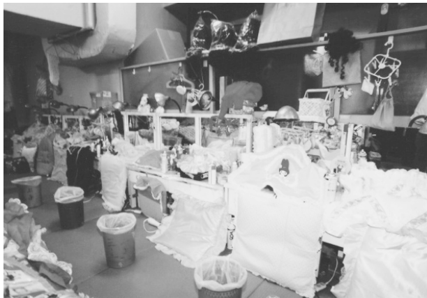
写真 - 4 . 東京宝塚劇場内大楽屋 (昭和9年開場 - 平成9年12月14日)

帝国劇場改革者が忘れていた根本的な視点である。上演内容と運営と空間が関連しあうことによってはじめて「劇場」の存在意義があるが、新しい劇場の在り方に伴って、舞台と客席との関係を構造的かつ心理的に近づけていた前舞台領域は変化を迫られた。すなわち、上演内容の多様化による歌舞伎劇場の前舞台領域の意味の消失とレビュー、新劇など新しい演出法に伴う新しい方向性の誕生であり、現代における劇場空間の多目的性の浸透を急速に促すものとなった。「営利的劇場とは全く絶縁する」と言って(1924)幕を開けた築地小劇場は小劇場としての行き方であり、小林一三も「大劇場論者」だけではなく、「小劇場」の使い方も考えていた一人だが、小劇場にしる大劇場にしる、劇場人たちは前舞台領域と演劇形式とを関連づけて実行したのも、人材、演出形式、空間、観客の融合を前提とした劇場創造を考えていたからである。