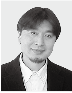
デザイン学部 生産造形学科 教授 大学院 デザイン研究科 教授