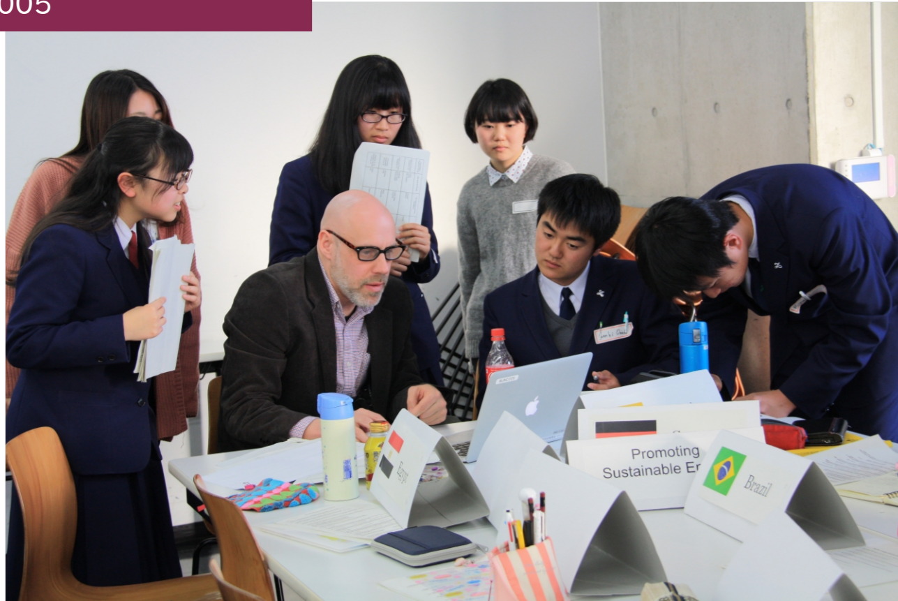
テーマについて語る様子