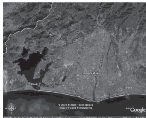
写真2 スイスと浜松(Google Earth 2006.9)