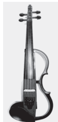
写真3 スイス モンディーン社 鉄道時計 ヤマハ(株) サイレントバイオリン