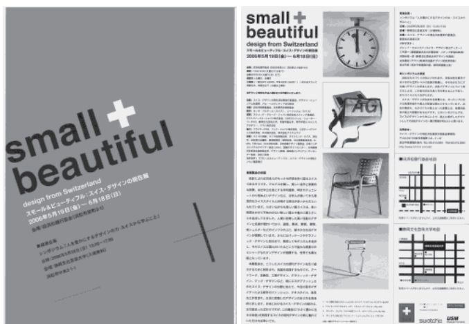
写真4 スイス・デザインの現在浜松展チラシ (デザイン：佐井国夫)

慶応義塾大学デザイン・ミュージアム・ファクトリー・コンソーシアムとスイスのプロ・ヘルヴェティア文化財団が企画した[スモール&ビューティフル：スイス・デザインの現在]を浜松地区で開催するため浜松地域で設立した実行委員会の主要メンバーとして企画・運営に参加した。同展を運営した組織は、この展覧会のために集まったボランティアで構成され、行政も学校や企業といった組織が主導することなく、産学官と市民とNPOが一体となった実行委員会であった。展覧会場も今後の活用を模索中の歴史的建造物である旧浜松銀行協会を使用するなど浜松地域のデザインに関係するネットワークづくりの種まきとなったと評価された（写真4）。