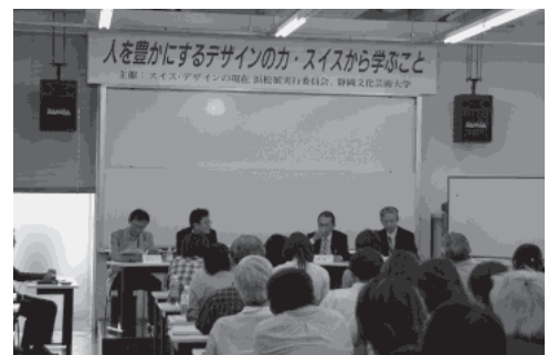
写真1 シンポジウム会場

*経歴はシンポジウム開催時、以下同様 シンポジウム「人を豊かにするデザインのカ・スイスから学ぶこと」(写真1)