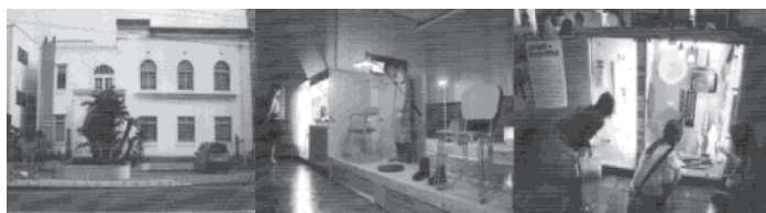
写真5 「スイスデザインの現在」浜松展会場