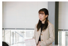
一般部門優秀賞受賞者