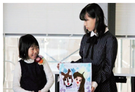
子ども部門佳作受賞者

UD絵本WSでは、未就学児から高齢者まで幅広い年代の方が、学生のサポートを受けてUD絵本制作を楽しんでいた。WS参加者のうち7人がUD絵本コンクール2019に応募してくれた（子ども部門6点、高校生部門1点）。子ども部門優秀賞1点と佳作1点は参加者の作品である。また、夏に本学で行われたアカデミックチャレンジ参加者4人が高校生部門に応募、優秀賞と佳作を受賞した。11月の展示会では、今回の応募作品のほか、過去の実績作品やパンフレットを展示し、10年のあゆみをたどれるようにした。宇城市立中央図書館が10年連続応募してくれている他、4年連続など繰り返しの応募者もみられる。応募を目標に作品を制作してこられた方もいて、少しずつではあるが本コンクールが定着してきた。展示会には視覚に障害のある方も来場され、子どもたちの工夫をこらした作品を楽しんでおられた。UD研究賞受賞の「ゆび物語」は聴覚特別支援学校の先生方に見ていただき、感想や要望をうかがった。こういった感想や要望は審査委員のコメントとともに作者の方に伝えている。制作者と必要としている人をつなぐことで、UD絵本の発展することを期待している。