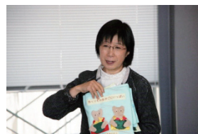
学生大賞受賞者による作品紹介