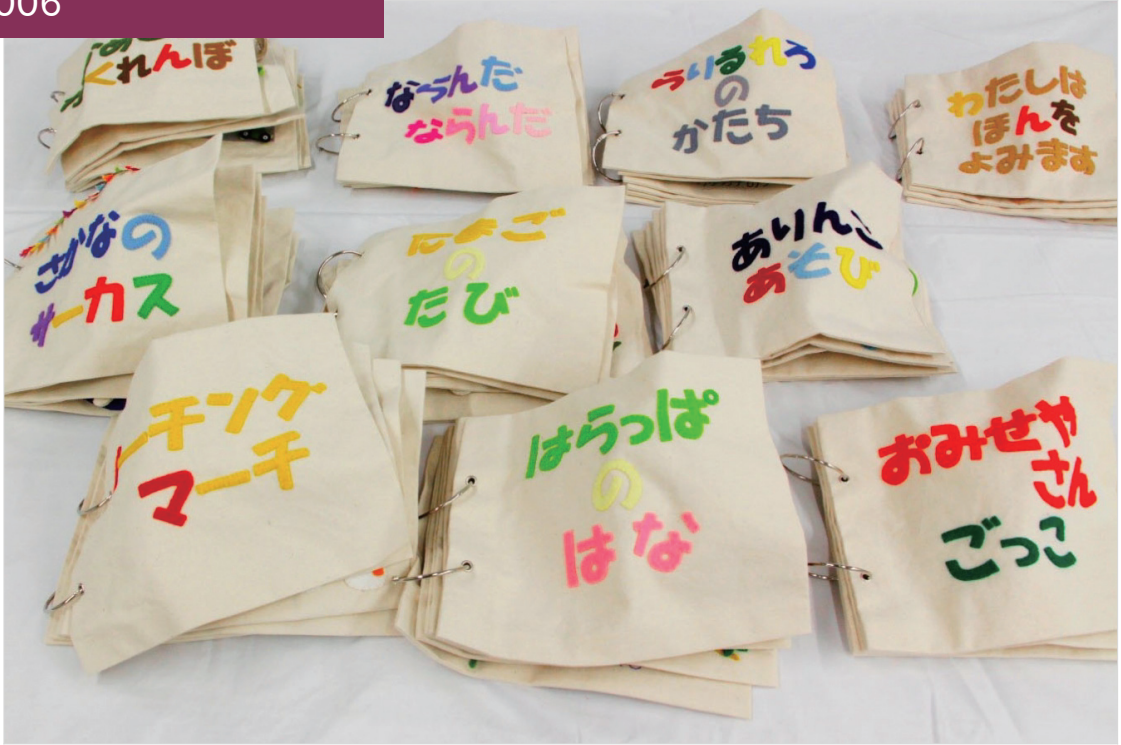
UD絵本コンクール2019 UD研究賞「ゆび物語」