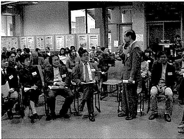
参加市民からの発言(バトルトーク)