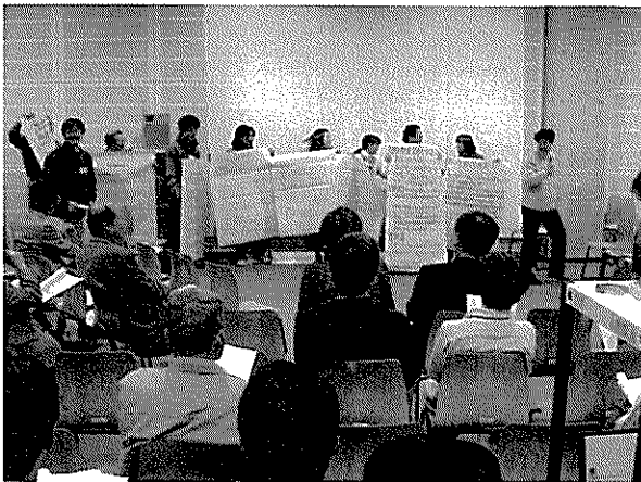
グループ活動の最終発表