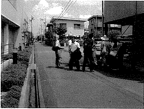
グループごとのまちあるき