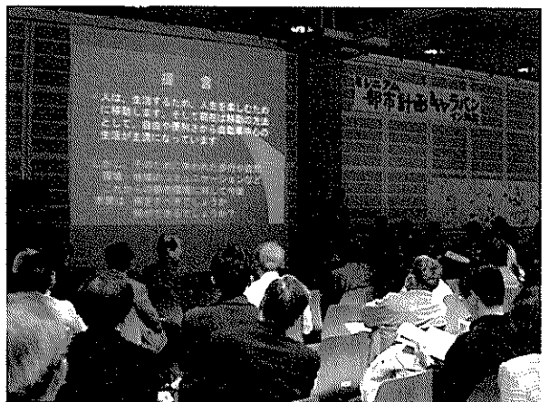
パワーポイントを使った発表