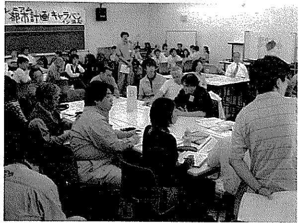
グループミーティング