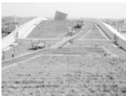
写真-9. 平成13年4月南棟中央ブロック

開学時にはシバ、クローバーとも発芽はほとんどみられず、薄綿ネットが表面を覆った状態であった。5月半ばになって水分や養分が溜まりやすいV字型の土留め堰上部と養分を仕込んだネットの俵部分で発芽が見られるようになったが、全体に発芽が遅れたことから5月末にシバとクローバーの追蒔きを行った。