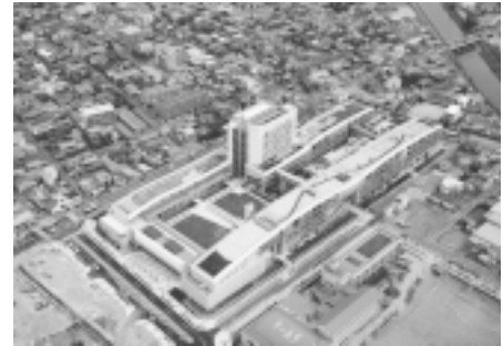
写真- 1. 開学時航空写真

実施設計段階では灌木類を主に庭園的な作り込みを行う案とローメンテナンスの作り込みを行わない草原型案が検討された。これは現在の屋上緑化における分類のIntensive (集約) 型とExtensive (粗放) 型の2つの手法にあたる。検討の結果、維持コストの少ない草原型緑地とすることが選択された。中間段階では、主な植栽としてクマザサ、ワイルドフラワー、ハーブなども考えられたが、最終的に以下が方針として決められた。