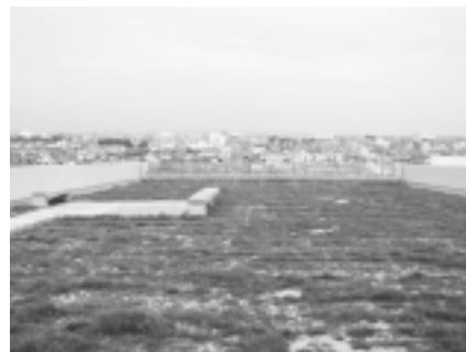
写真-2. 平成12年4月19日北棟東ブロック