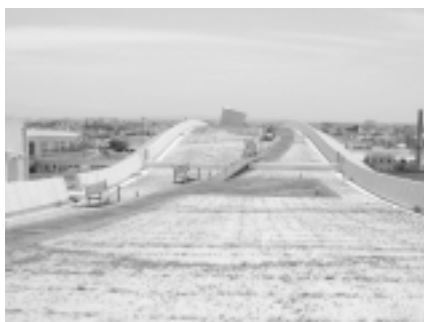
写真-7. 平成12年6月1日南棟中央ブロック