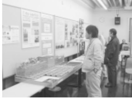
写真－12. 緑花関連情報の展示