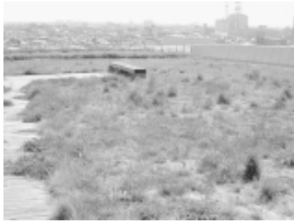
写真-5. 平成13年4月北棟東ブロック

開学時にすでに冬シバの発芽が多く見られた。北棟東側は施工が早かったため平成12年の秋期に冬シバとクローバーが発芽しており、この時点で10cm程度まで草丈が伸びていた。緑被率は目視で10～15%。他の部分では表面を覆うネットが目立っていた。