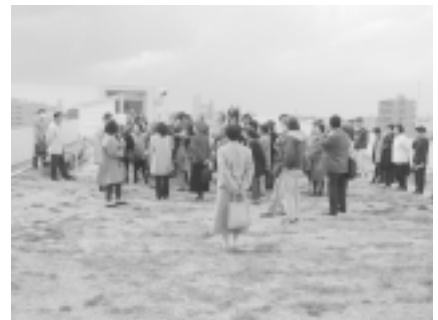
写真-10. 創造の丘ツアー

シンポジウムに並行して静岡県、浜松市、及び研究会メンバー企業等により緑花関連情報の展示が行われた。県が主催したガーデンデザインコンテスト作品パネル、パシフィックフローラ関連情報、屋上緑化の実物サンプル展示、緑花関連図書の紹介など豊富な内容で参加者に好評であった。