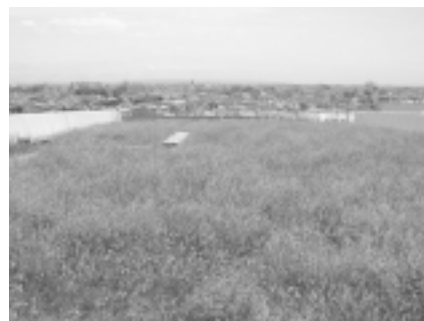
写真-3. 平成12年6月1日北棟東ブロック