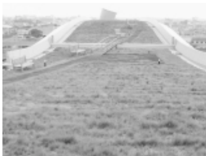
写真-8. 平成12年8月15日南棟中央ブロック