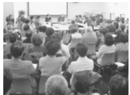
写真-11. シンポジウム会場