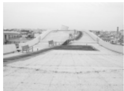
写真-6. 平成12年4月19日南棟中央ブロック