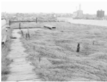
写真-4. 平成12年8月15日北棟東ブロック