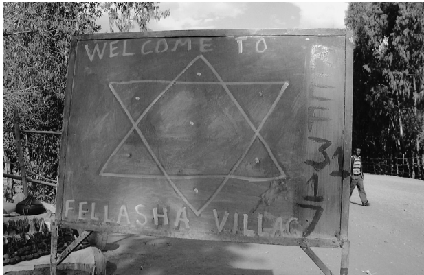
写真 4 現在のファラシャ村の入口にある看板。

〔これは平成 15 年度静岡文化芸術大学文化政策学部長特別研究費の助成を受けました。〕