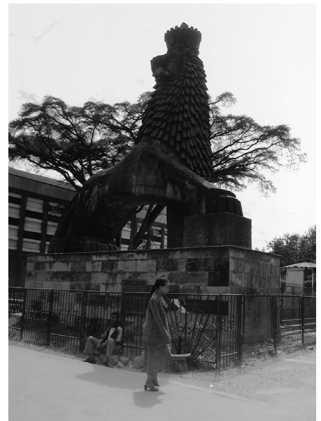
写真1 アディスアベバの国立劇場の前にあるライオン像。統治者「ユダの獅子」の象徴であった。現在は観光名所

20世紀に飛ぶと、1916年から30年まで摂政であったハイレ・セラシエが、ソロモン王の流れをくむ第225代皇帝となる。ハイレ・セラシエは、アムハラ語で「三位一体の力」を意味し、「王の中の王」や「ユダの獅子」を通称に、絶対的権力を掌握していった。