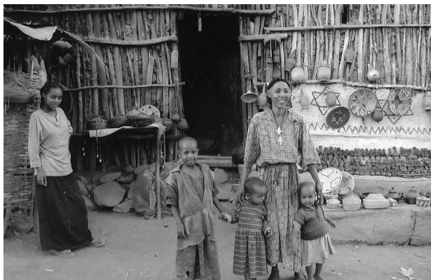
写真 5 ファラシャ村で