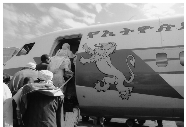
写真2 国営エチオピア航空の航空機にライオンのマーク