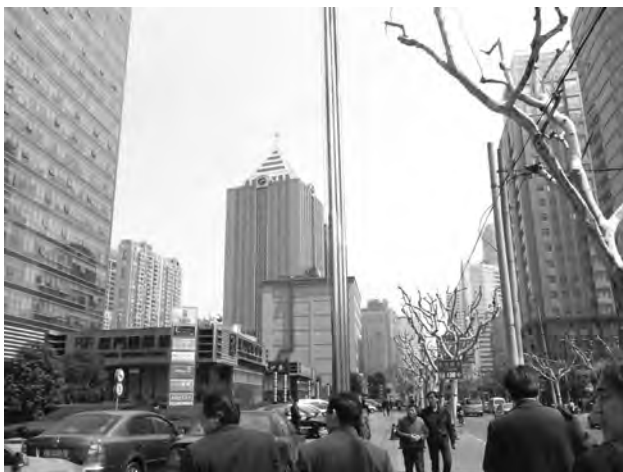
写真.1 上海工程技术大学周辺の街並