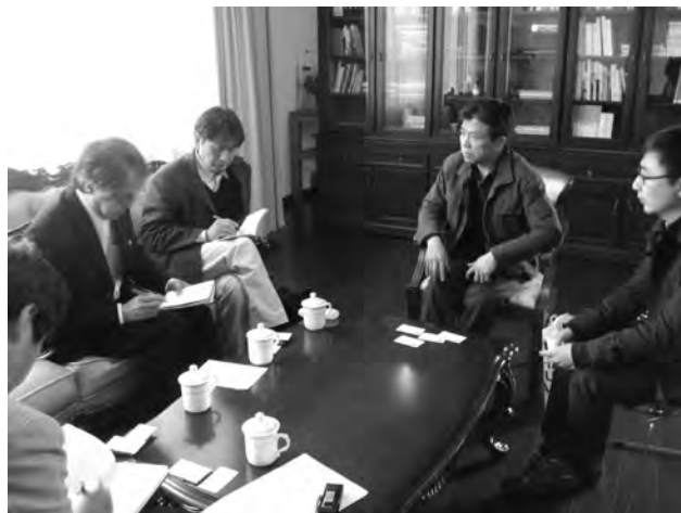
写真.6 復旦大学上海視覚芸術学院でのヒアリング