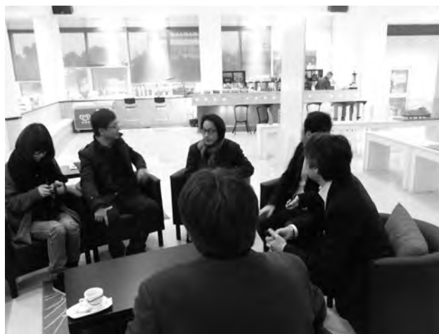
写真.8 復旦大学上海視覚芸術学院の交流施設