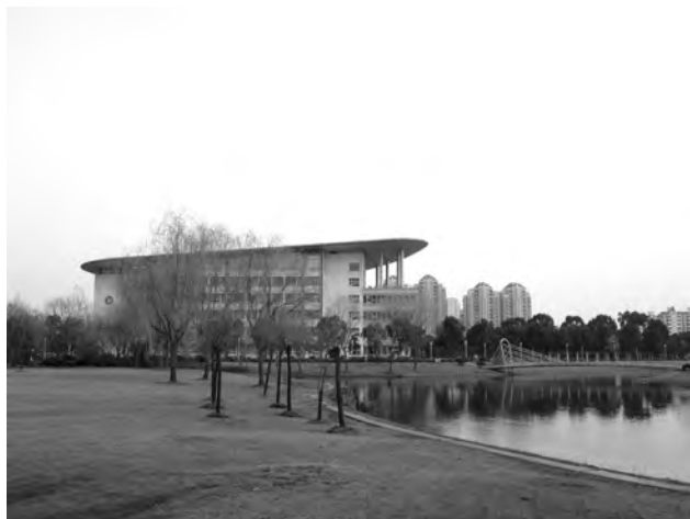
写真.5 広大な敷地の復旦大学

この他にも、上海市中に 1933 年の建築を改装して、ギャラリー・研究室・バーを複合した M30 という施設（約 1200 ㎡）を持ち、社会や都心への接点としているようである。