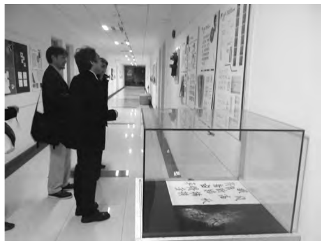
写真.7 復旦大学研究室棟廊下の学生作品

今回訪問先（GK 上海）では、企業と日本の教育研究人材のマッチングが認められるため、このような発想が可能となった。