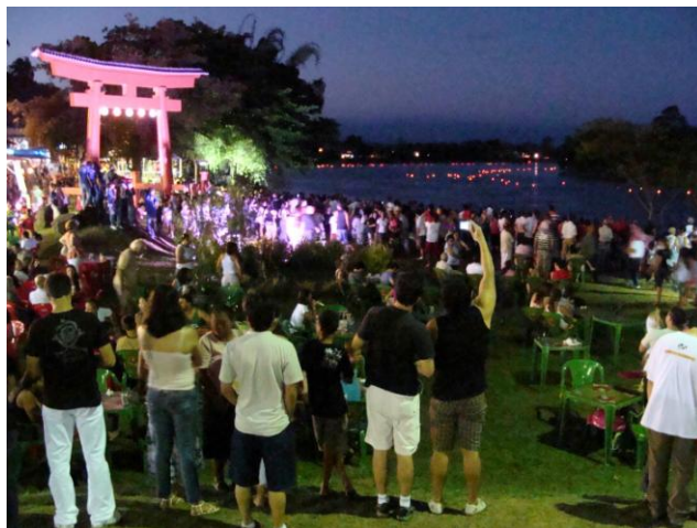
写真8 = 奉納相撲のひとこま